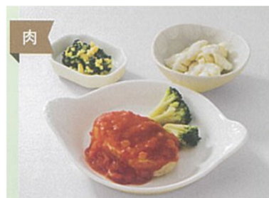
イタリアンハンバーグ